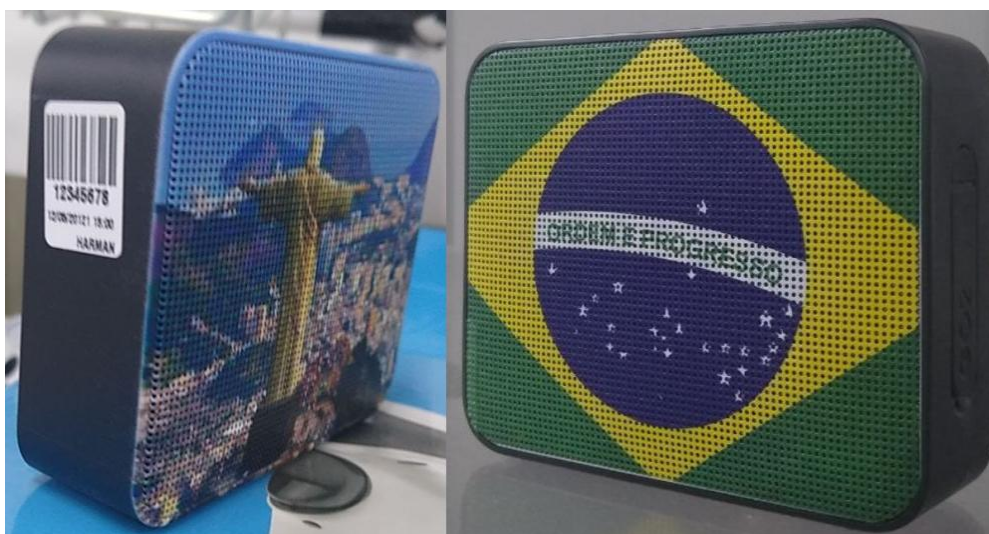
Figura 1. Exemplos de personalizações feitas pela Harman

No Brasil, a empresa possui fábricas instaladas em Manaus (AM) e Nova Santa Rita (RS). Nos Estados Unidos, oferece o serviço de personalização de produtos via e-commerce. Através dele, é possível escolher imagens pré-definidas ou importar fotos particulares para que sejam impressas nos produtos.